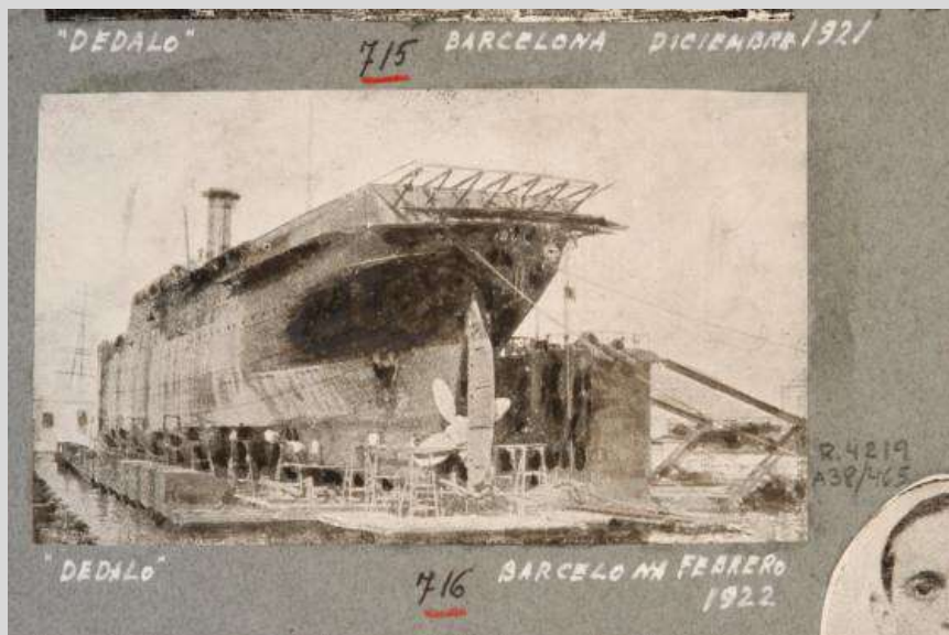
Obras de transformación del vapor Dédalo.