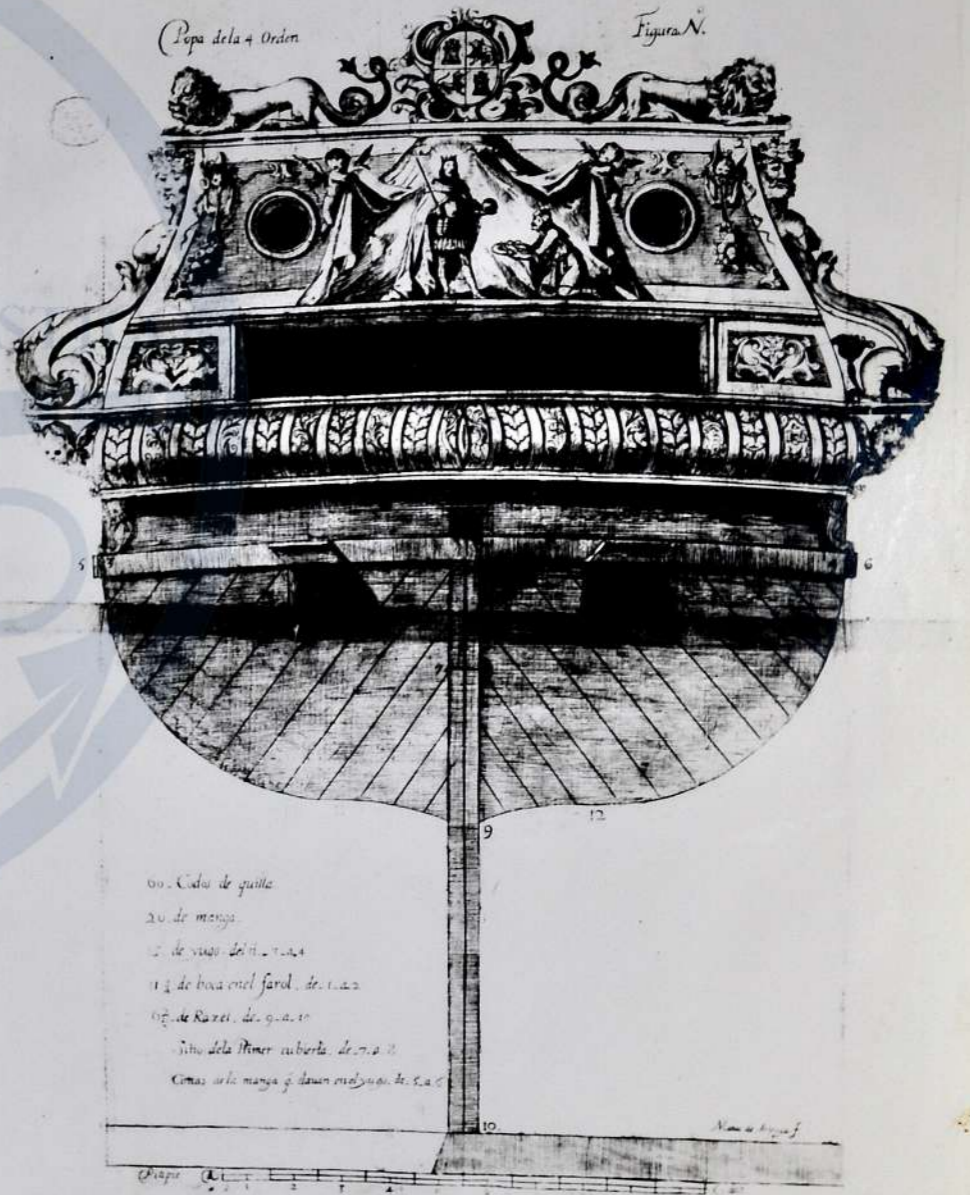
Pepa de la 4. Orden. Figura N.