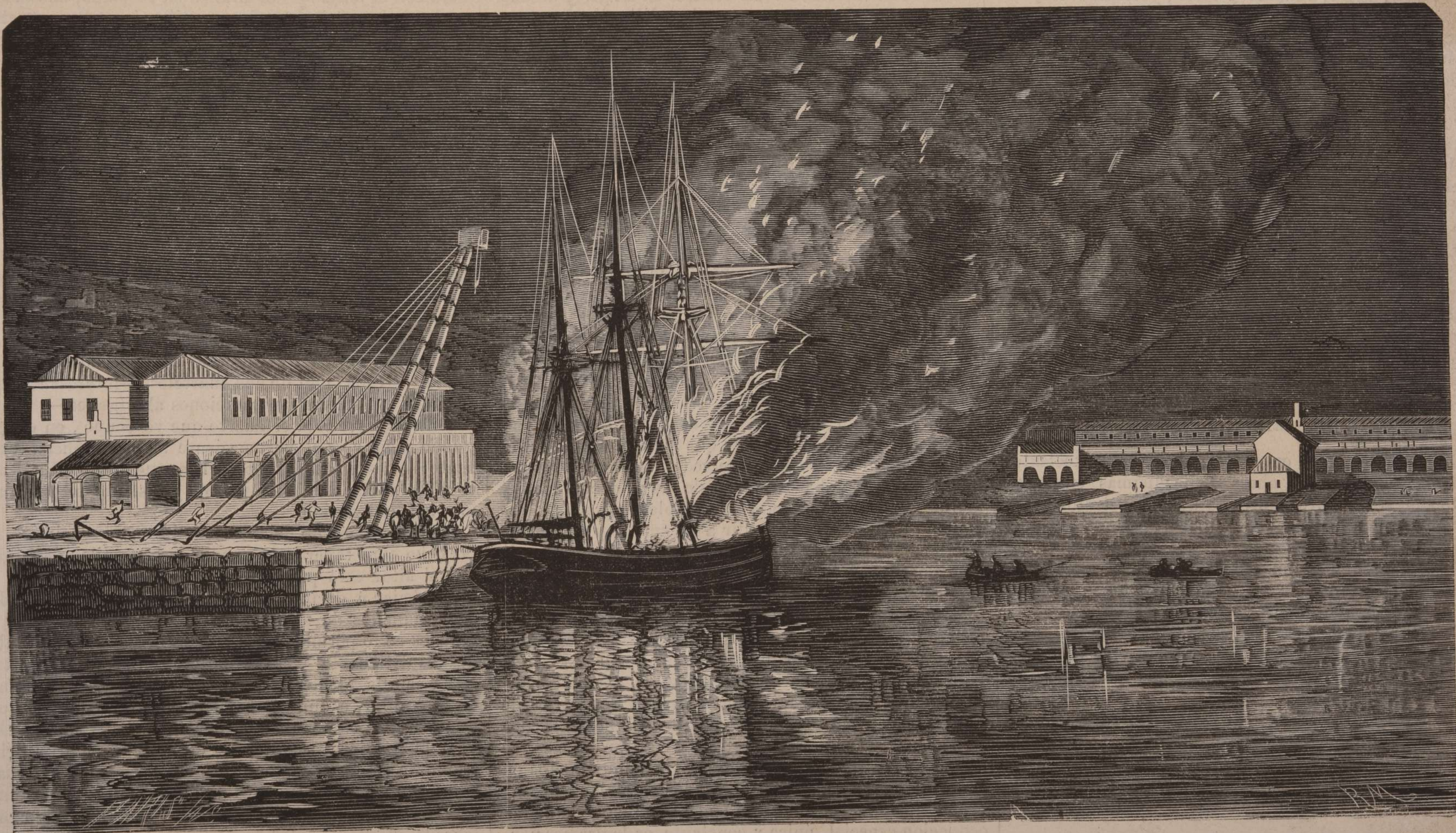
FERROL.—Incendio de la goleta de guerra Buenaventura .